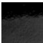
Metal black chrome

Per ulteriori specifiche sui prodotti consultare il listino.