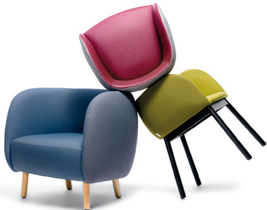
mousse design Tommaso Caldera

Morbida, soffice e dolce come le sue forme, Mousse è una seduta golosa che attira a sé l'attenzione e soddisfa il palato di chi apprezza i sapori nuovi ma senza rinunciare alla tradizione. Ideata dal gusto fresco e creativo di Tommaso Caldera, la seduta Mousse rivisita, in chiave contemporanea, lo stile classico della poltrona da living adatta a interni residenziali come a bistrò e ambienti lounge. La collezione, infatti, si articola in due varianti che si abbinano in modo armonioso ed equilibrato: la Mousse SP, più alta e contenuta, e la versione Mousse P avvolgente e adatta a zone relax e waiting hall. Entrambe le sedute, dal sapore lievemente retrò, si apprezzano anche per il particolare abbinamento di tessuti che possono prevedere gli interni in una tinta differente dagli esterni e la possibilità di comporre la seduta con materiali diversi come la stoffa ignifuga e l'ecopelle, ingredienti anche questi indispensabili per personalizzare in modo creativo e unico la propria Mousse.